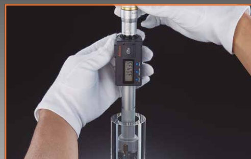
Typische Anwendung eines Holtests