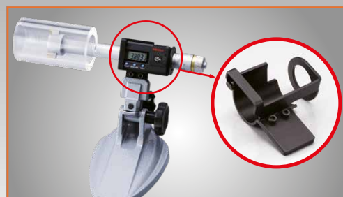
HALTERUNG FÜR MESSSCHRAUBENSTÄNDER 04AZB157 inkl. Bügelmessschraubenständer 156-101-10